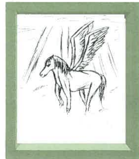
ひあたり野津田登録 sさん